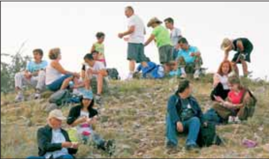
Στάση και κολατσιό στη Χαλικόβρυση