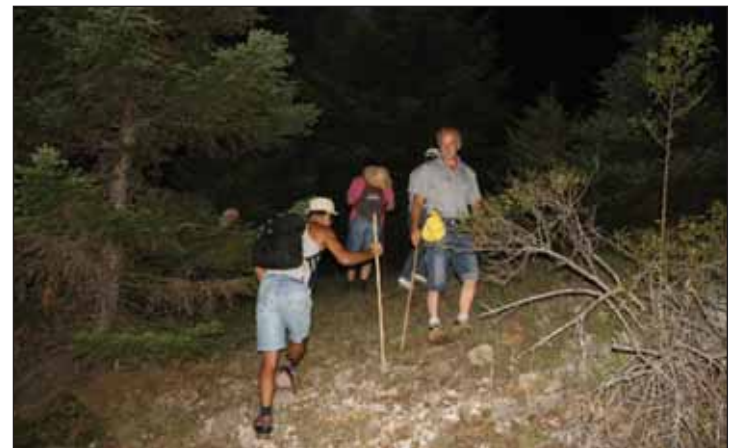
Πριν καν ξημερώσει, οδοιπόροι προσκυνητές πήραν τα βουνά.