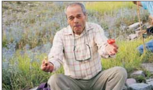
Ναι, δάσκαλε, το ξέρουμε ότι και τη μπουκιά σου δίνεις απλόχερα.