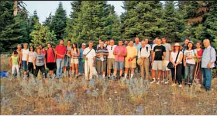
Στημένοι μπρος στο φακό αγναντεύουμε πάνω απ' τα βουνά εκστασιασμένοι από την ομορφιά του ροδαλού ήλιου που ξεπροβάλλει...